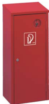
Plåtsåp med nyckellås